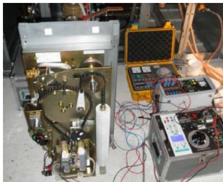
Maintenance des disjoncteurs HT