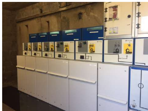
Remplacement rame complète HTA (avant et après travaux)