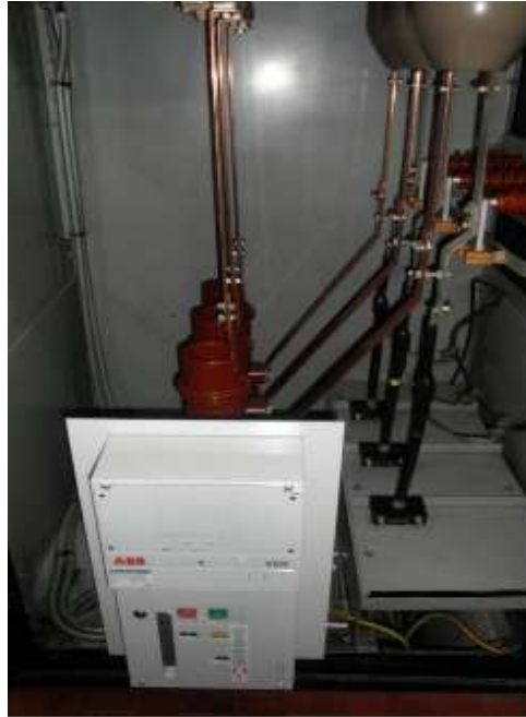
Rétrofit disjoncteurs type CB-CEM par disjoncteurs type FD4-ABB