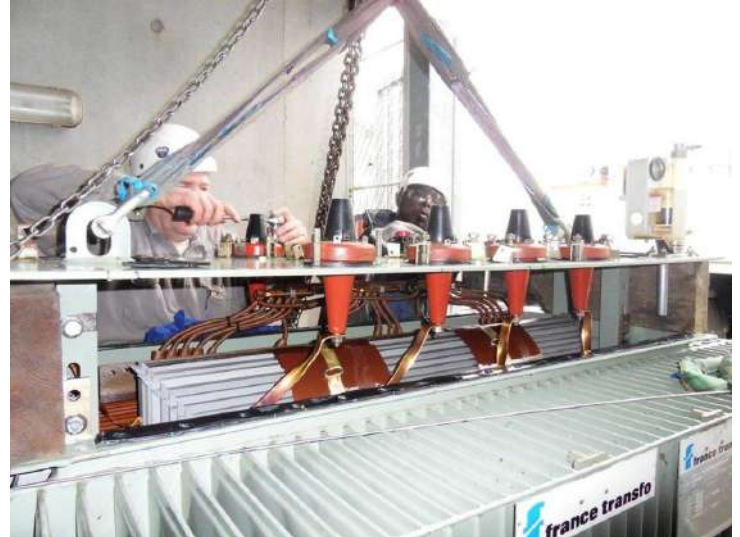
Travaux sur site