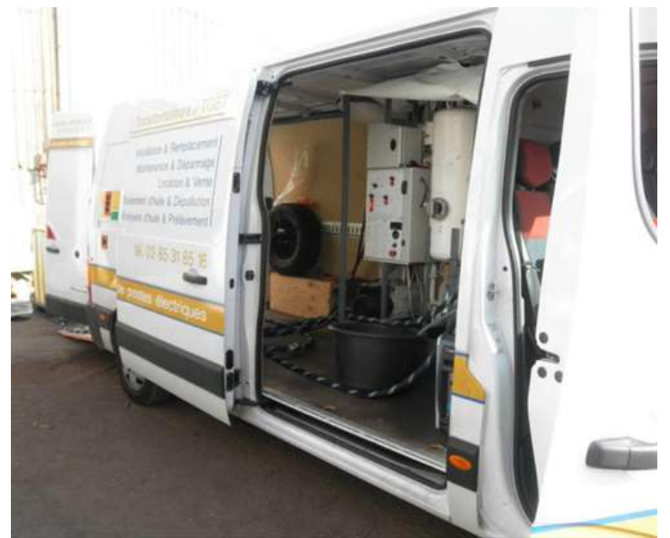
Traitement de la charge d'huile Dépollution