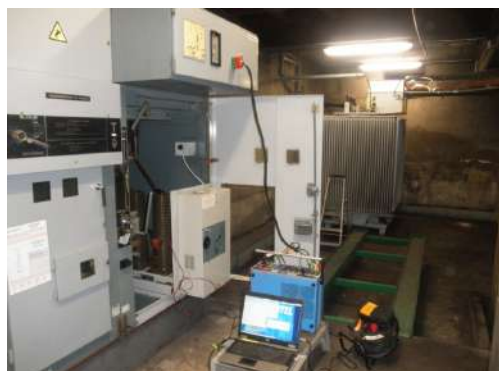
Contrôle et essais relais HTA