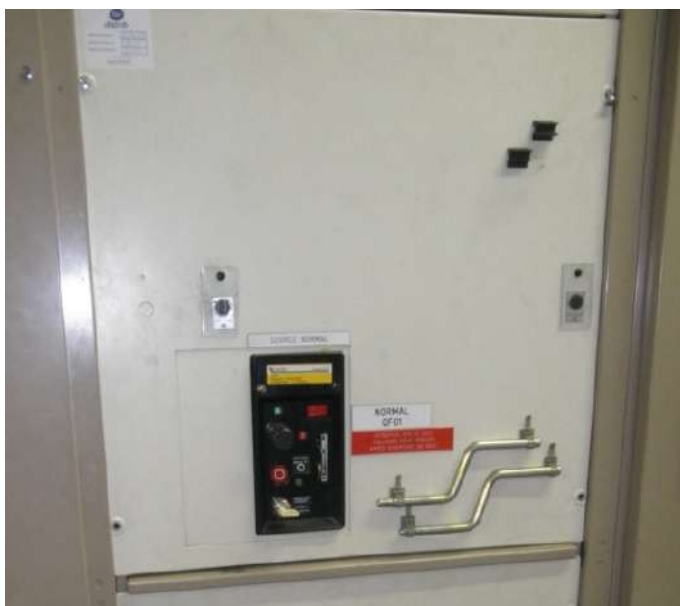
Avant et après travaux