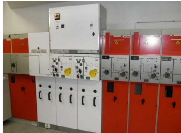
Remplacement des cellules normal / secours